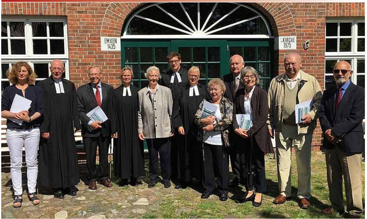
Der ausscheidende Gemeindegkirchenrat