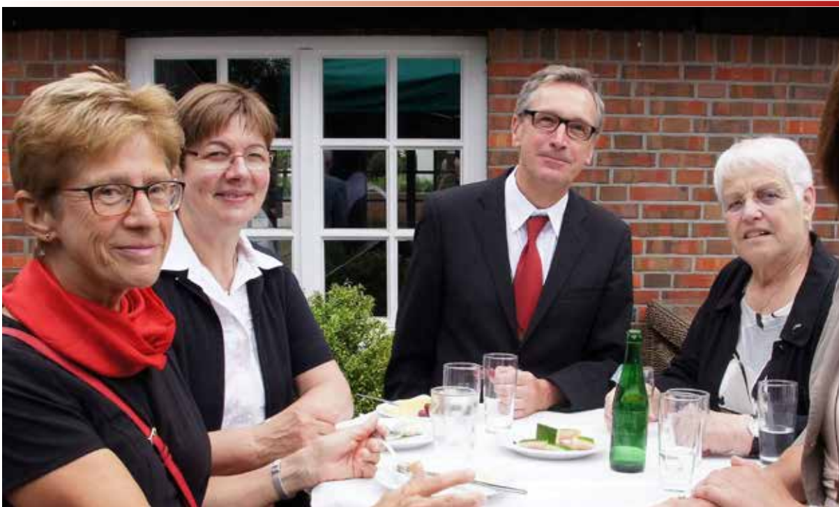
Empfang nach der Einführung des neuen Gemeindegkirchenrates